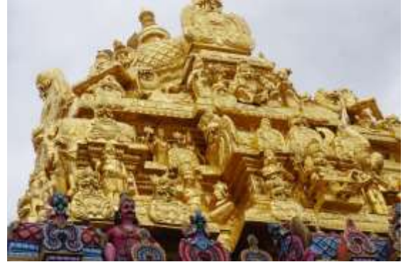
Swarna Vimanam of Andal Sannidhi