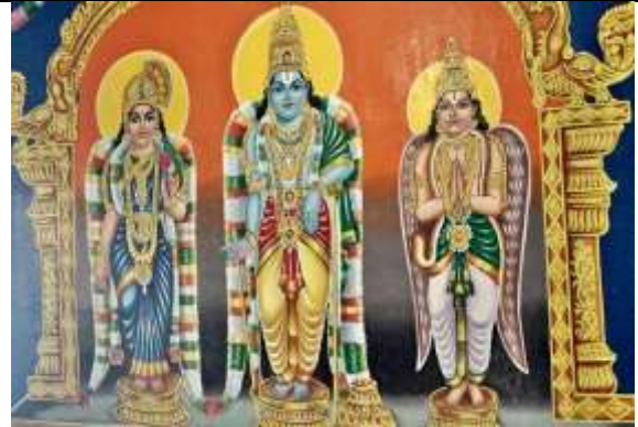
Images in the temple