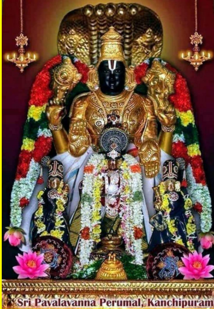
Sri Pavalavanna Perumal, Kanchipuram